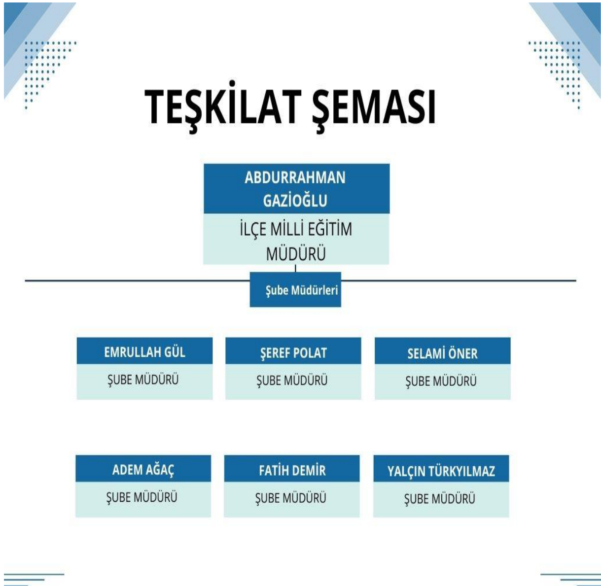
Tablo 8: Yakutiye İlçe Millî Eğitim Müdürlüğü Teşkilat Şeması

birer öğretmen, rehberlik ve araştırma merkezî müdürü ve köyde çalışan üç öğretmen, en fazla öğrencisi olan özel okul öncesi, özel ilkokul, özel ortaokul ve özel lise kurumlarının müdürleri ile bunların öğretmenler kurulunca seçilecek birer öğretmenden oluşur. Ayrıca İlçe Millî Eğitim Müdürlüklerinde, İlçe İstihdam ve Meslekî Eğitim Kurulu ile İlçe Millî Eğitim Disiplin Kurulu oluşturulmuştur.